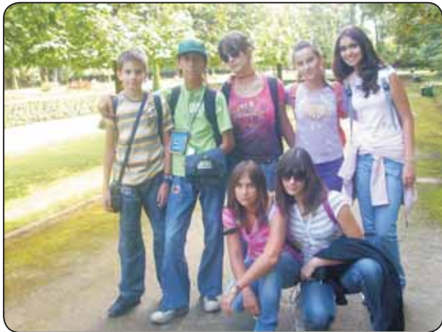
Na wycieczce w Lublinie

Popatrzcie, czy nie jesteśmy piękni, zadowoleni, uśmiechnięci, pełni życia i radości.