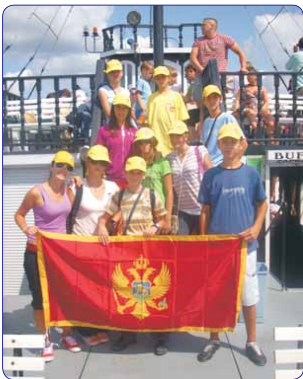
Statkiem po Wiśle

Ta „ Kraina” jak ją nazwaliśmy to pierwsza lub druga Ojczyzna ( zależy od punktu widzenia ) naszych rodziców, dziadków ... . To POLSKA . Dosyć długo czekaliśmy na spotkanie z nią. Niektórzy z nas byli w Polsce, ale jako małe dzieci i niewiele pamiętają.