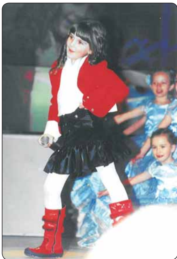
Fot. Lorena na festiwalu „Zlatna Pahuljica”