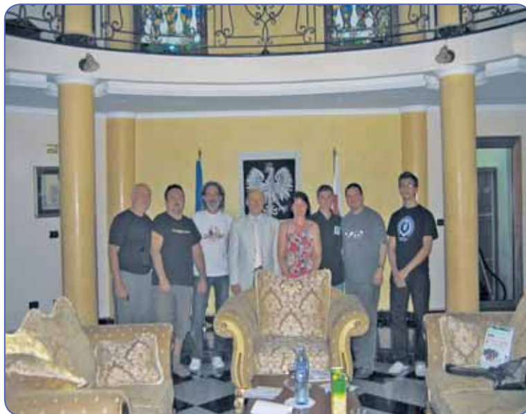
Fot: Członkowie zespołu z ambasadorem Jarosławem Lindenbergiem i jego małżonką w salonach Ambasady